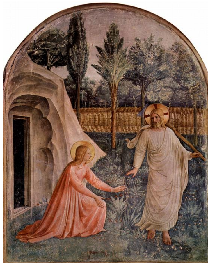
Fra Angelicos Noli Me Tangere , San Marco i Firenze.