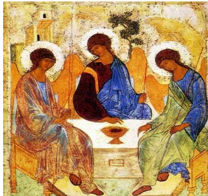
1. Mos. 18, 1-15

Der er stilhed i "Udsigten", i Kirken, og under måltiderne undtagen ved første og sidste måltid.