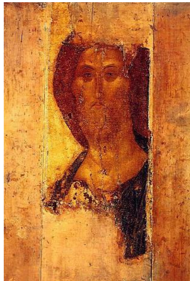
Andrei Rublev: Kristus-ikon fra 1400-tallet