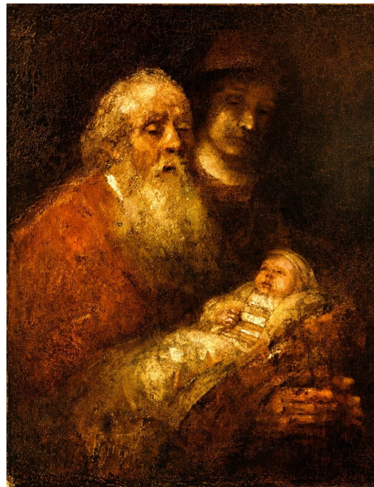
Rembrandt: Simeon og Jesusbarnet