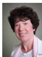
Biskop Lise-Lotte Rebel