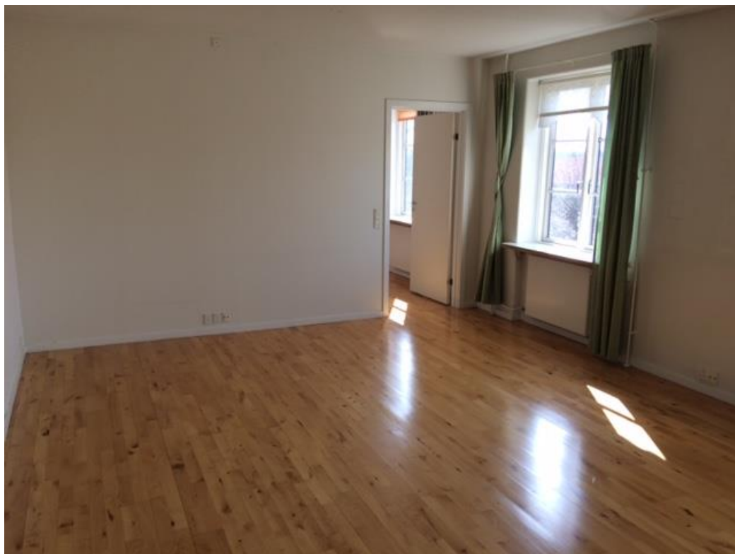
Soveværelse - skabsvæg